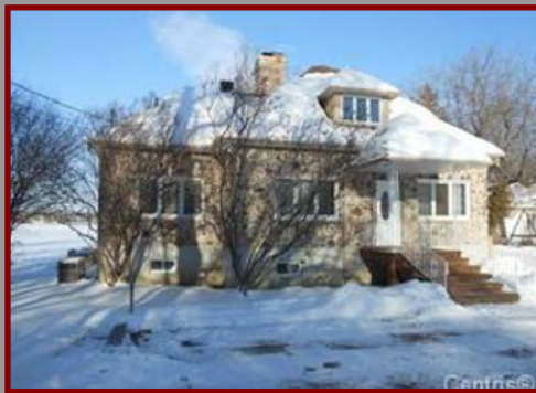
385 Boul. Perrot L'Île-Perrot, J7V 3G7 432 000$