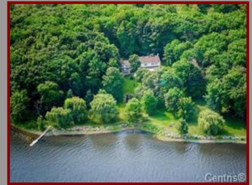
580 Boul. Perrot N. L'Île-Perrot, J7V 3K1 1 250 000$