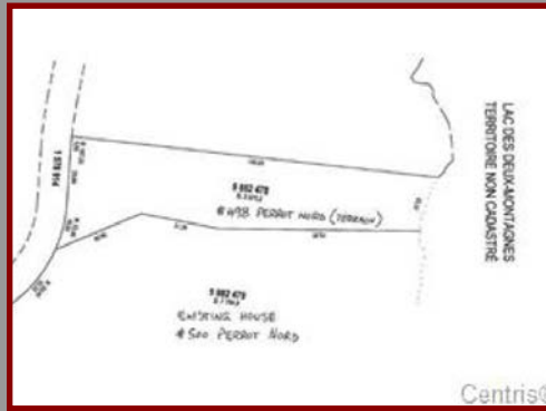
500 Boul. Perrot N. L'Île-Perrot, J7V 3K1 500 000$