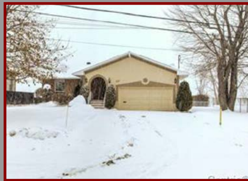
237 Mtée Sagala L'Île-Perrot, J7V 3C8 520 000$