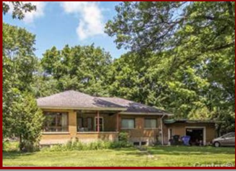
48 Boul. Perrot N. L'Île-Perrot, J7V 3K1 284 500$