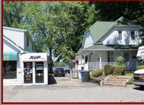
375-379 Boul. Perrot L'Île-Perrot, J7V 3G7 629 900$