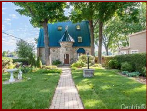
30 Rue Henriette L'Île-Perrot, j7v 3b6 5 700 000$