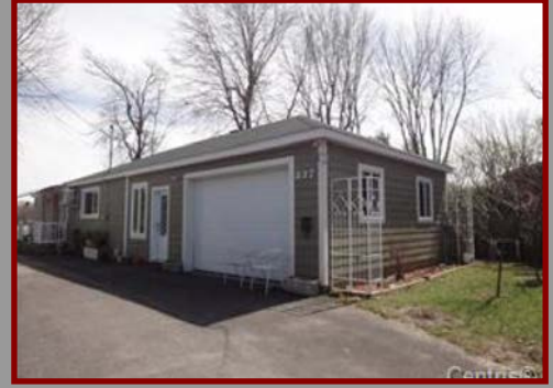
337 Mtée Sagala L'Île-Perrot, J7V 3B9 399 900$